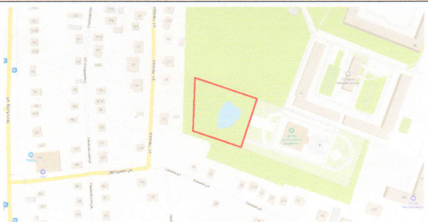
Благоустройство озера в парке при центре культурного развития. Продолжение реализации концепции «Кинель – город чистых озёр» - г. Кинель, в р-не ул. Фестивальная, 18